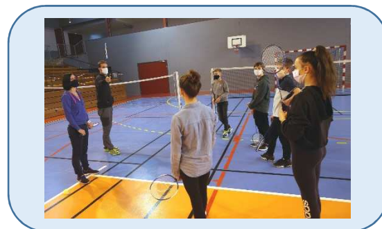
Olympiade et défis sportifs